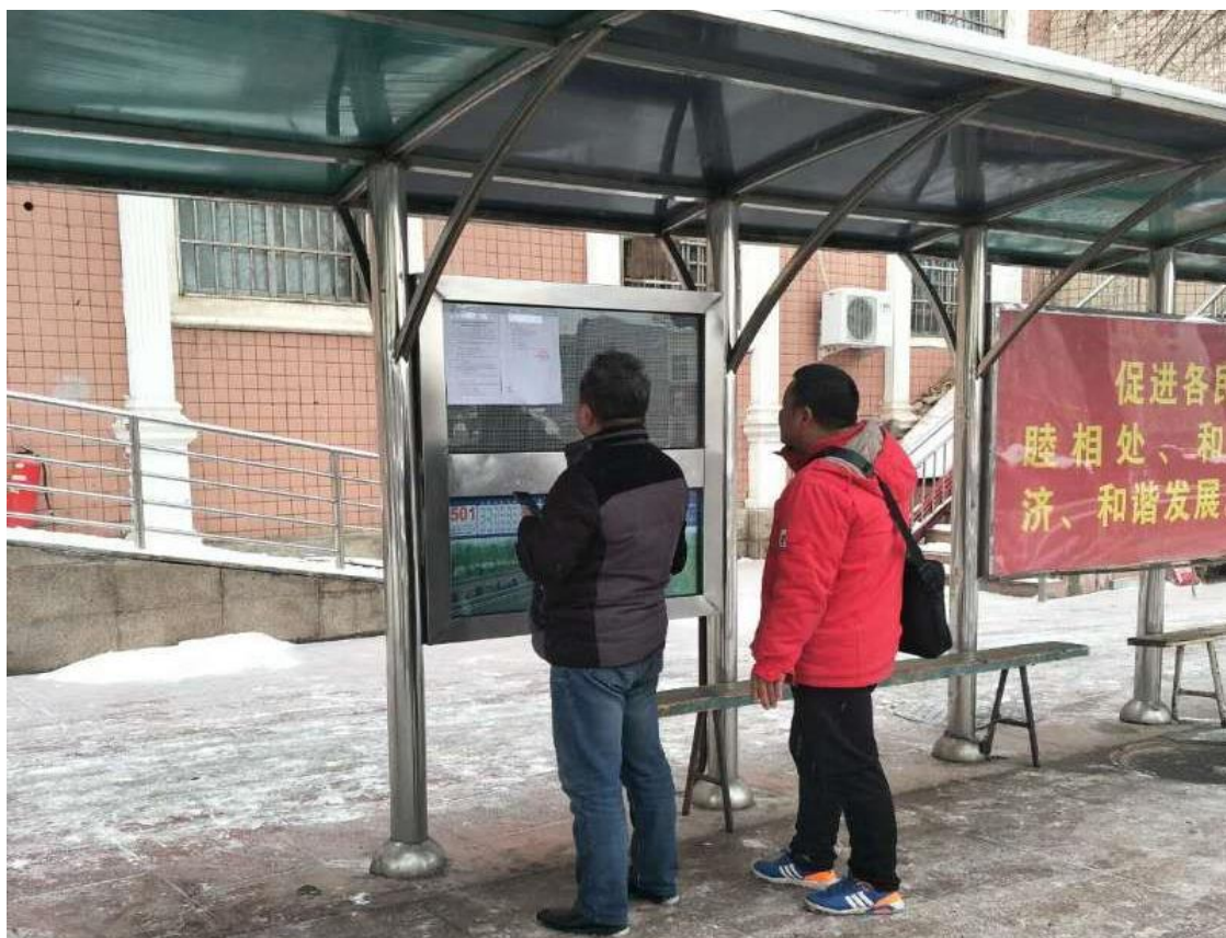
图 3-4 征求意见稿张贴公告公示截图 (a)

克拉玛依快达环保科技有限公司于 2019 年 1 月 14 日在项目所在区域周边公交车站牌公告栏张贴了项目第二次公众参与公示信息。公示时间为 10 个工作日。张贴区域的选择符合《环境影响评价公众参与办法》要求。张贴照片见图 3-4 和图 3-5。