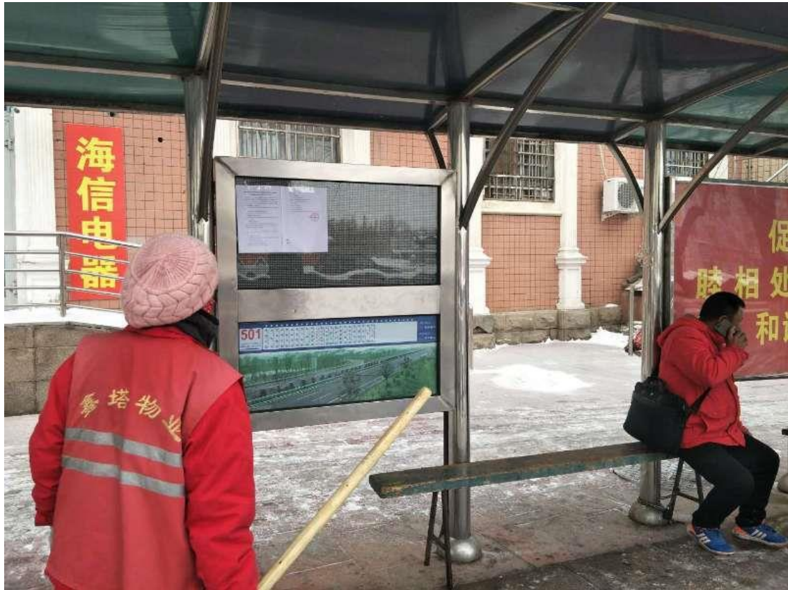
图 3-4 征求意见稿张贴公告公示截图 (b)