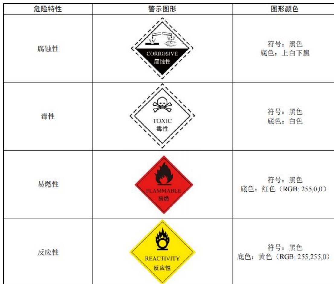
图 5.2-3 危险废物类别标识示意图

c. 材料应坚固、耐用、抗风化、抗淋蚀。危险废物相关信息标签如图 5.2-4 所示。