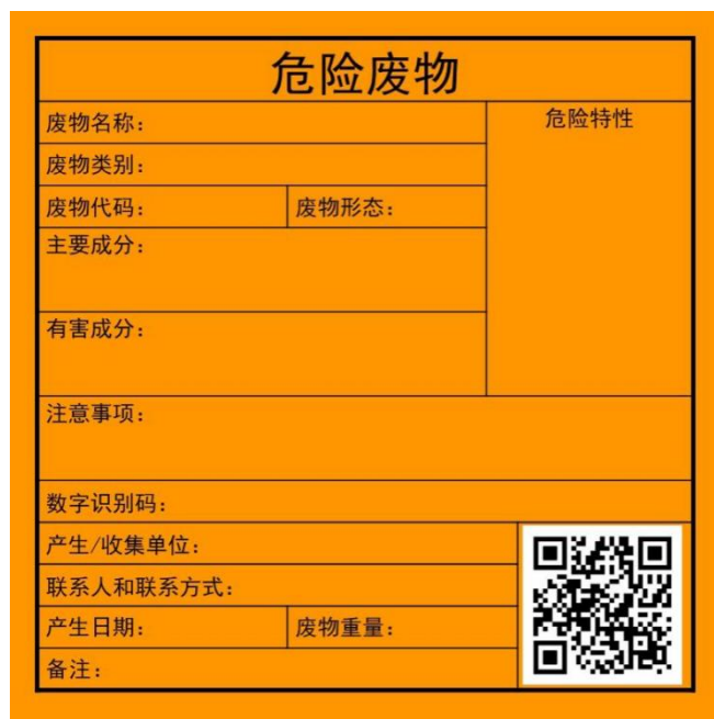
图 5.5-2 危险废物相关信息标签

d、装载液体、固体的危险废物的硬质桶内必须留足够的空间，硬质桶顶部与液体表面之间保留 100mm 以上的空间。