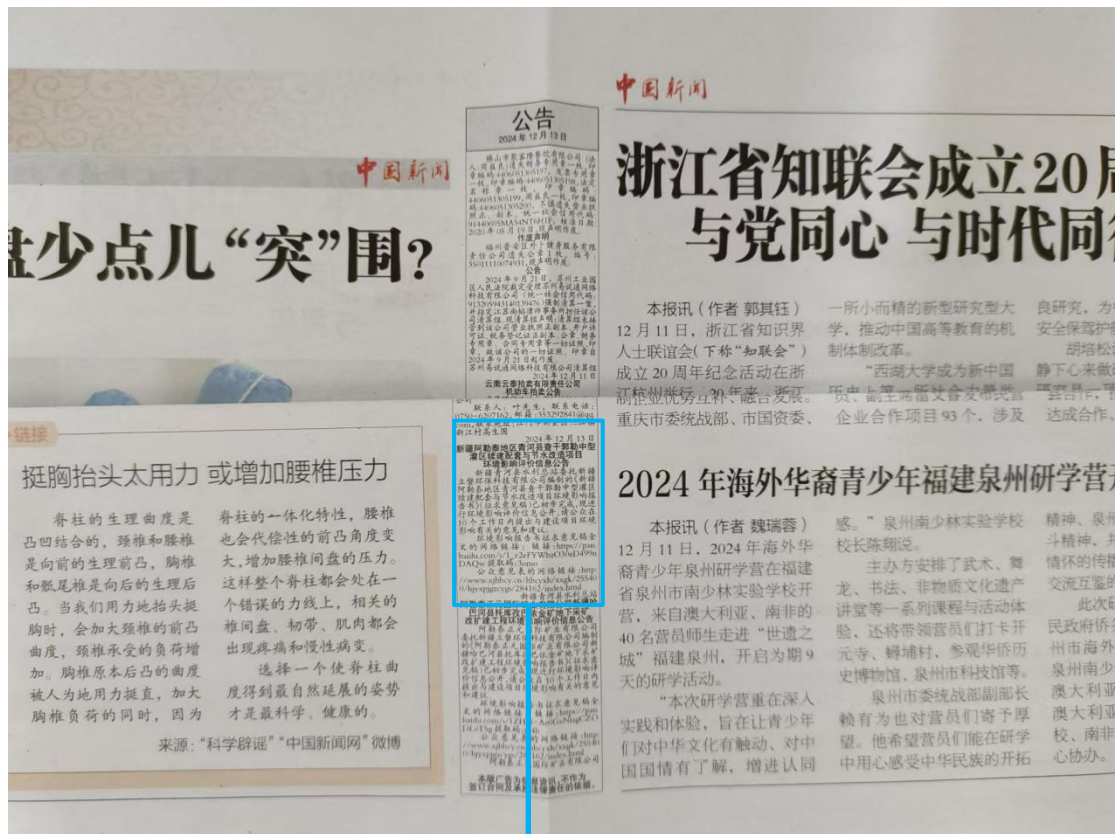
图3 第一次报纸公开照片 (2024.12.13)