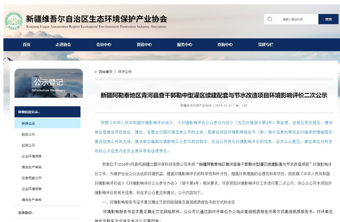
图2 征求意见稿网络公示截图