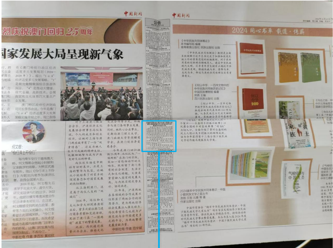
图4 第二次报纸公开照片 (2024.12.17)