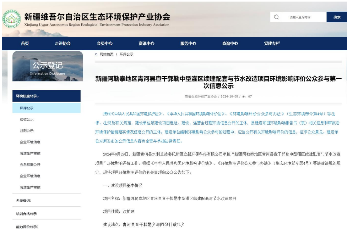
图1第一次网络公示截图