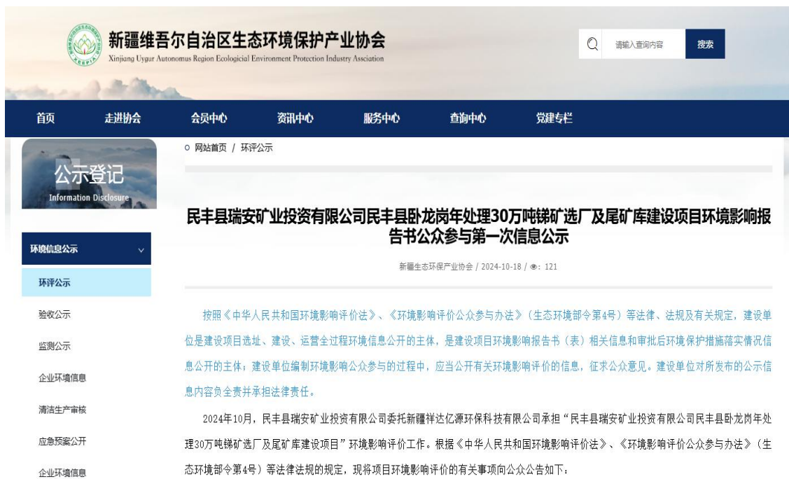
图 2.2-1 本项目第一次网络公示截图

民丰县瑞安矿业投资有限公司在新疆维吾尔自治区生态环境保护产业协会网站开展网络公示，载体选择符合《环境影响评价公众参与办法》要求。公示链接： http://www.xjhbcy.cn/blog/article/13685 ，网络公示截图见图2.2-1。