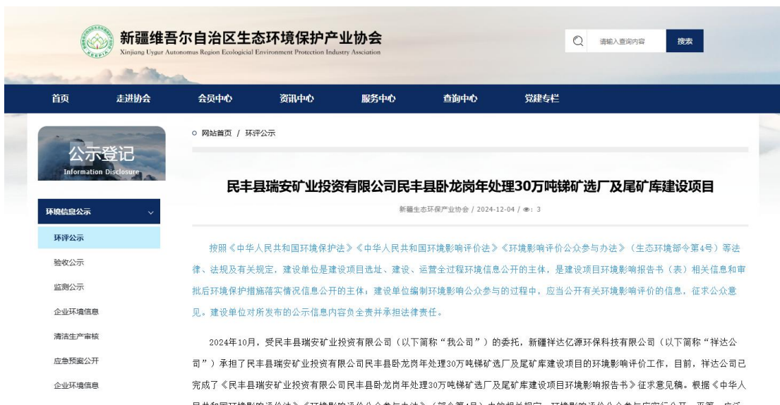
图 3.2-1 本项目征求意见稿网络公示截图