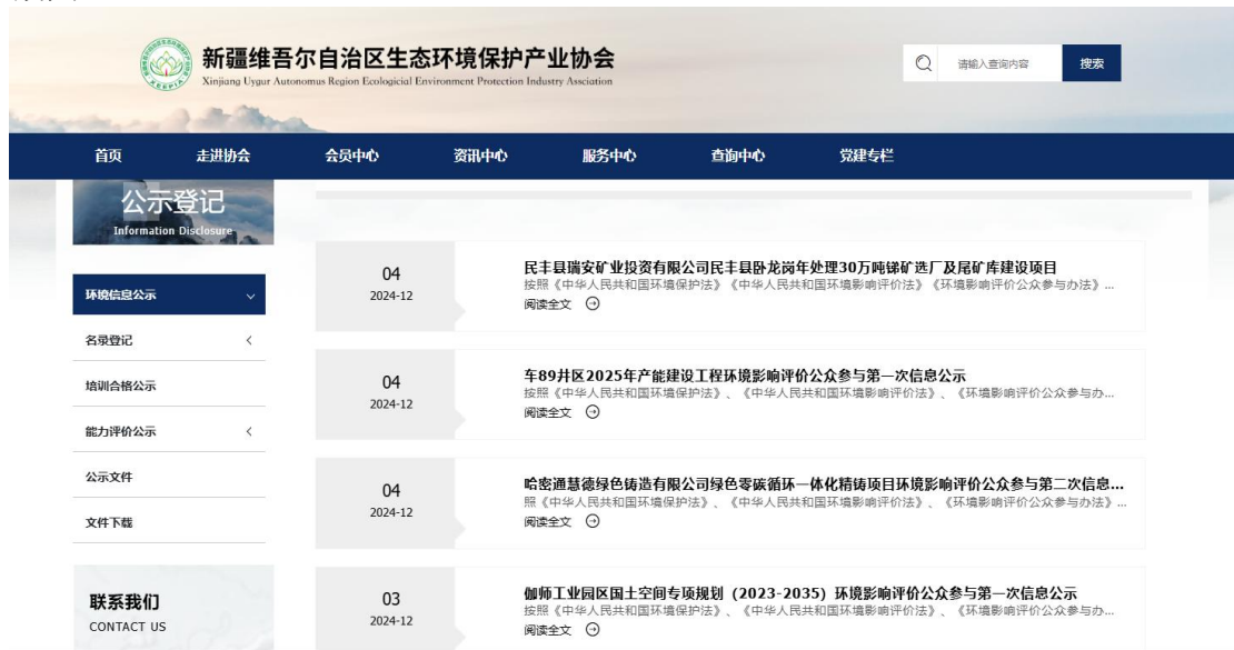
图 6.1-1 报批前网络公示截图