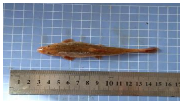
长身高原鳅 ( Triplophysa tenuis )

繁殖时间为 6-8 月，绝对怀卵量平均为 1125-3222 粒，相对怀卵量平均为 168301 粒/g，卵径平均为 0.6-0.8mm。