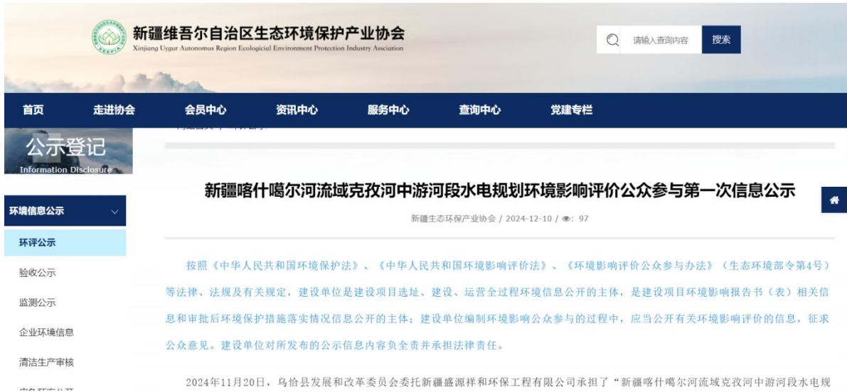
图 9.1-1 首次环境影响评价信息网络公示截图