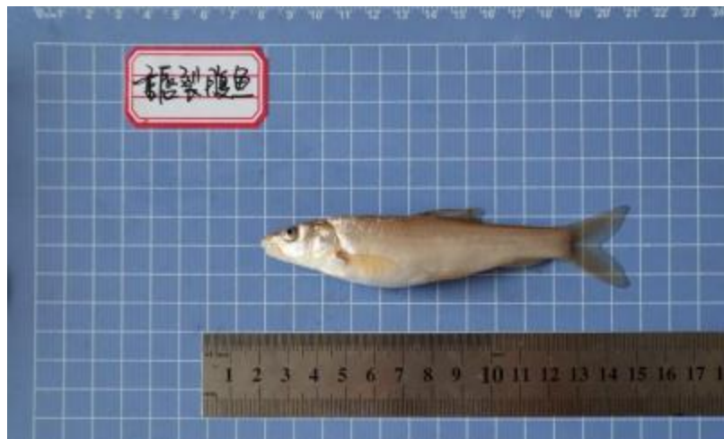
重唇裂腹鱼 ( Schizothorax barbatus )