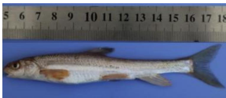
斑重唇鱼 ( Diptychus maculatus )

繁殖时间为 7 月，繁殖水温 20℃,无洄游产卵特性，卵粘性。产卵于河道沿岸缓水处、河湾及河汊汇流处，以及水库沿岸的砾石或植物基上。绝对怀卵量平均为 2432 粒，相对怀卵量平均为 872 粒/g。