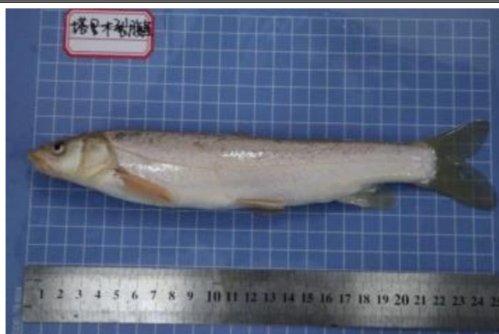
塔里木裂腹鱼 ( Schizothoraxm biclululphi )