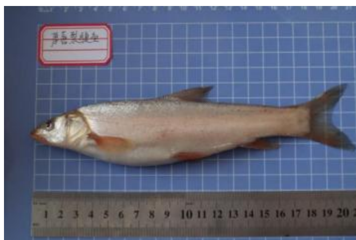
厚唇裂腹鱼 ( Schizothoraxirregularis )

该鱼的繁殖与塔里木裂腹鱼相似，每年 5-7 月份为主要产卵繁殖季节，掘坑产卵。雌雄鱼的主要鉴别主要从臀鳍大小区分，雌性个体臀鳍相对较长，且手感肥厚；雌性个体臀鳍则相对较小。