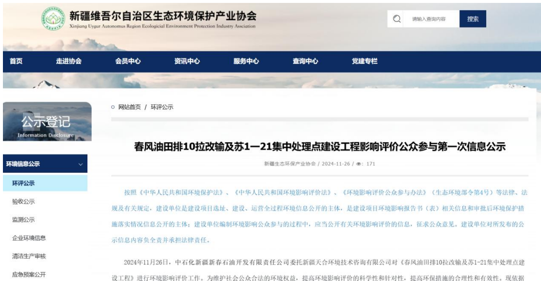
图 2.2-1 本项目第一次网络公示截图

中石化新疆新春石油开发有限责任公司在新疆维吾尔自治区生态环境保护产业协会网站开展网络公示，载体选择符合《环境影响评价公众参与办法》要求。公示链接： http://www.xjhbcy.cn/articles/show/14394 ，网络公示截图见图 2.2-1。