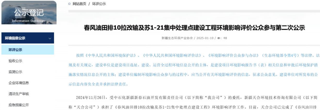
图 3.2-1 本项目征求意见稿网络公示截图