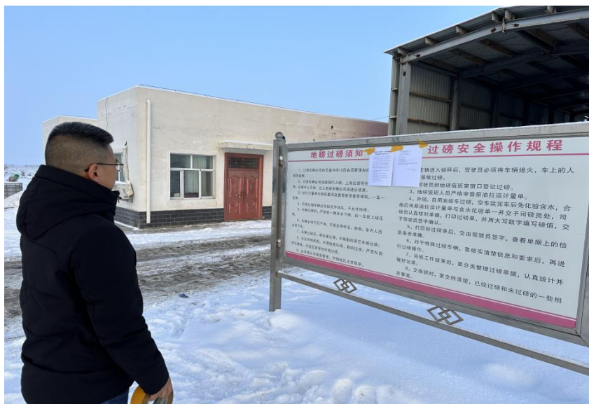
图 3.2-4 本项目张贴公示栏照片

在第二次公示期间，本项目在项目所在地公示栏进行了张贴公示，载体选择符合《环境影响评价公众参与办法》要求。张贴公示照片见图 3.2-4。